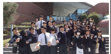
海響館の前で ハイ、ポーズ！