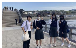
錦帯橋は日本三名橋の1つ