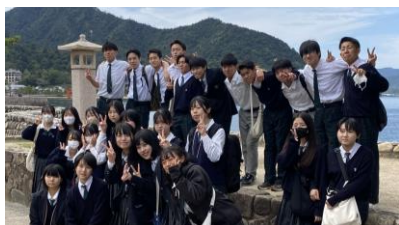
宮島は日本三景の1つ