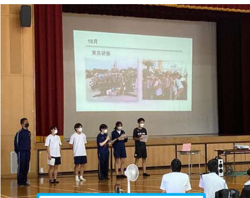
生徒会中心の学校紹介

7月29日(金)、本校にて第2回オープンスクールを行いました。この日は県内でバスツアーも開催され、鹿足をめぐるツアーに参加された中学生や保護者の皆さんにもご来校いただき、中学生32名、保護者28名、教員1名の合計61名にご参加いただきました。今回は、『吉高ライスバーガー』を販売し、購入者から「ボリュームがあっておいしかった！」という感想をいただきました。午後から、生徒会が中心となり下記のような流れで進行しました。吉賀町役場高校支援室のスタッフによる説明会では、サクラマス交流センター(学生寮)の寮生がセンターの魅力を生の声として伝えPRしました。最後は部活動を体験してもらいました。