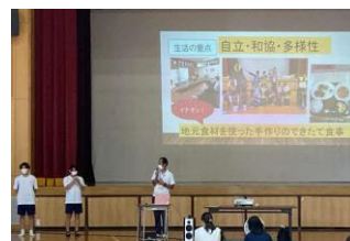
吉賀町役場支援室による説明