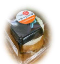
吉高ライスバーガー