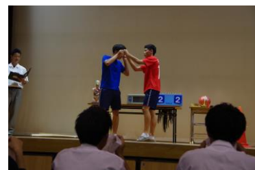
盛り上がった有志発表!