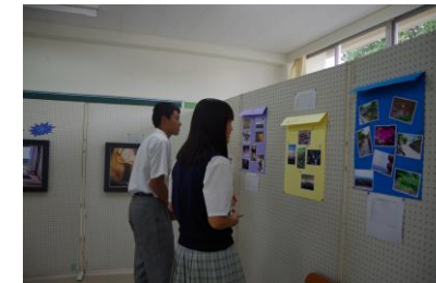
力作揃いの部活・委員会展示