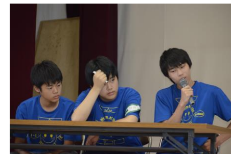
色組対抗ディベート