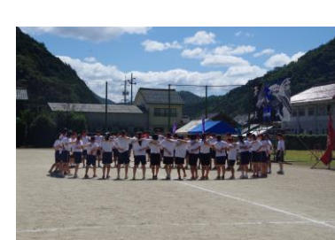
円陣を組んでいます！