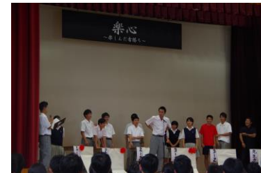
熱唱もあった生徒会企画