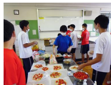
↑販売に向けて製作中! ↓一生懸命販売・接客しました