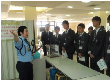
[写真左]ディズニーアカデミー・[写真中]ディズニーランド・[写真右]石見空港：写真左のディズニーアカデミーでの研修を行い、ディズニーが考えるおもてなしの心を学びました。ディズニーランド内で楽しみながら、ディズニーで働く人たちの様子もしっかり見てきました。また、地元の石見空港の見学もしました。グラントワにも行きました。