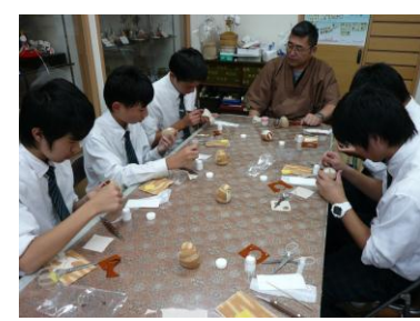
[写真左]工房体験(KAMISM lab)・[写真中]工房体験(紗蔵)・[写真右]工房体験(塚田工房)：生徒が3つのグループに分かれて、それぞれの工房でものづくりに挑戦しました。とても楽しい研修になった様です。