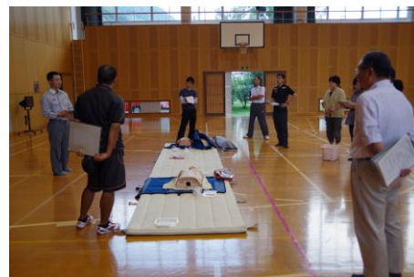
【写真上】心臓マッサージと人工呼吸の訓練の様子。かなり体力の必要な処置である事を実感しました。【写真下】緊急時のための講習。専門の救命士の説明を真剣に聞き、緊急時の対応について考えました。職員の質問に対し、的確な返答をしていただきました