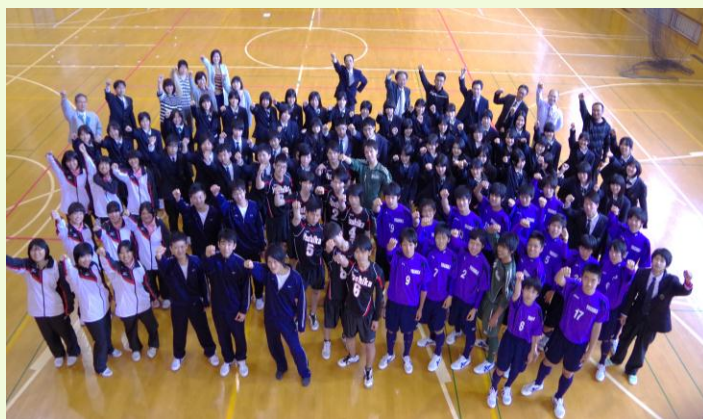
みんなでがんばろう！！

さて、先日、高校総体の壮行式を行いました。各部のキャプテンは、対戦相手や自分たちの思いをしっかりと語ってくれました。かなりの強敵と戦うようです。選手達は、これから緊張や迷いや不安、場合によっては焦りなど、いろいろな感情にとらわれるのかもしれません。しかし、そうした心に打ち勝って自分たちの持てる力を堂々と発揮することにこそ、大きな価値があると考えます。相手の強さや自分たちの不完全さを充分に知り、その上で、それでも相手に勝つことを信じて存分に力を発揮する、そういう吉高生を信じて、私たちはしっかりと応援したいと思います。